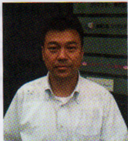
Kouマスター株式会社