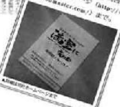
▲同社ホームページまで

賃貸住宅のリフォーム工事、賃貸住宅運営コンサルティングなどを手掛けるコウマスター(大阪市北区)は、同社が既にノウハウの一部を、事業などに活用してきている。タイトルは「空きアパート・マンション経営に変わる新しいノウハウ」。詳しい内容は、同社ホームページ http://www.koumaster.com/ まで。