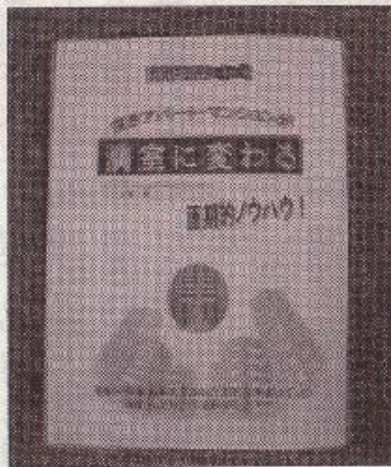
▲初心者でも分かりやすい内容